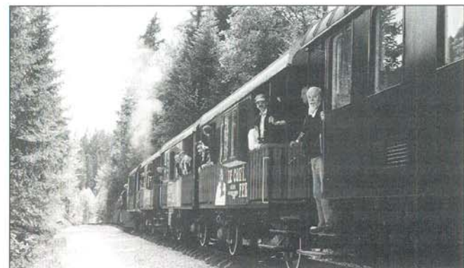
Le « Conti Fer » Pontarlier-Vallorbe dans la forêt.

Aujourd'hui, les deux tiers des chemins de fer touristiques français sont réunis au sein de la FACS-UNECTO qui a signé la première charte pour le développement des chemins de fer touristiques et historiques avec les Ministères des Transports et de la Culture, les Secrétariats d'État au Tourisme et au Patrimoine, Réseau Ferré de France, la SNCF, etc... pour traiter des problèmes liés à la réglementation, la sécurité, les subventions, le classement des matériels. De plus, la FACS-UNECTO est co-fondatrice de la Fédération Européenne FEDECRAIL.