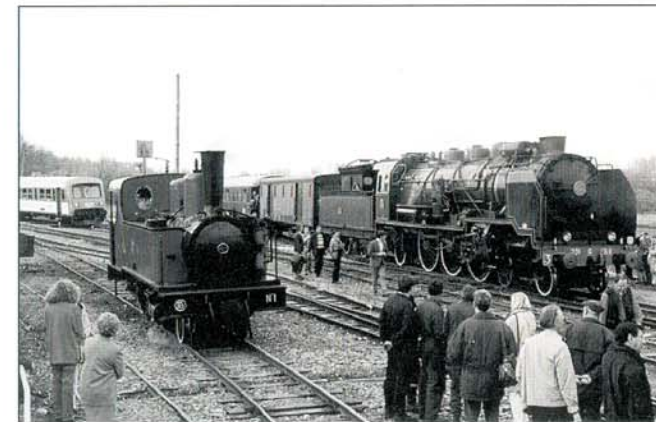
Festival vapeur, Baie de Somme.