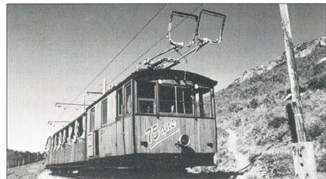
Crémaillère de la Rhune.

La plupart des derniers chemins de fer secondaires existants ont été supprimés dans les années soixante. Les premiers sauvetages de lignes ont été réalisés par des membres de la FACS qui exploitent toujours, à des fins touristiques, les réseaux de Pithiviers, d'Abreschviller, du Vivarais, de la baie de Somme. Ces premières tentatives, heureusement couronnées de succès, ont ouvert la voie à de nombreuses exploitations touristiques, en voie étroite ou normale, y compris parfois en vélo-rail.