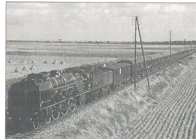
Train d'excursion : Pacific 231 K 8.

En outre, la FACS-UNECTO a sauvé plusieurs locomotives et véhicules remorqués à voie de 0,60 qui circulent sur des Chemins de Fer Touristiques.