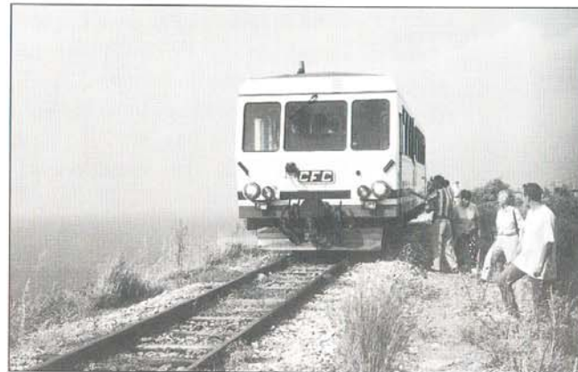
Arrêt photo, chemin de fer corse.

Un grand nombre de ces voyages sont effectués en traction vapeur, de préférence sur des réseaux à voie étroite, ainsi que sur des réseaux de tramways, un mode de transport urbain défendu avec foi par la Fédération et dont le retour dans les principales villes françaises est spectaculaire!