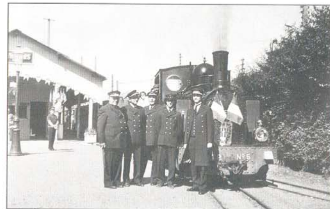
Chemin de fer de Pithiviers.

Ce terme regroupe tous les chemins de fer, y compris urbains (tramways et métros), quel que soit l'écartement de leurs voies, hors du réseau ferré national construit à voie normale (1,435 m) et exploité par la SNCF depuis 1938. A leur apogée, dans les années 1930, ces multiples réseaux, la plupart à voie métrique, totalisaient en France plus de 20000 km. Souvent chemins de fer départementaux, ils avaient été construits à l'économie le long des routes (tramways) ou en site propre, ce qui permettait de bien meilleures performances.